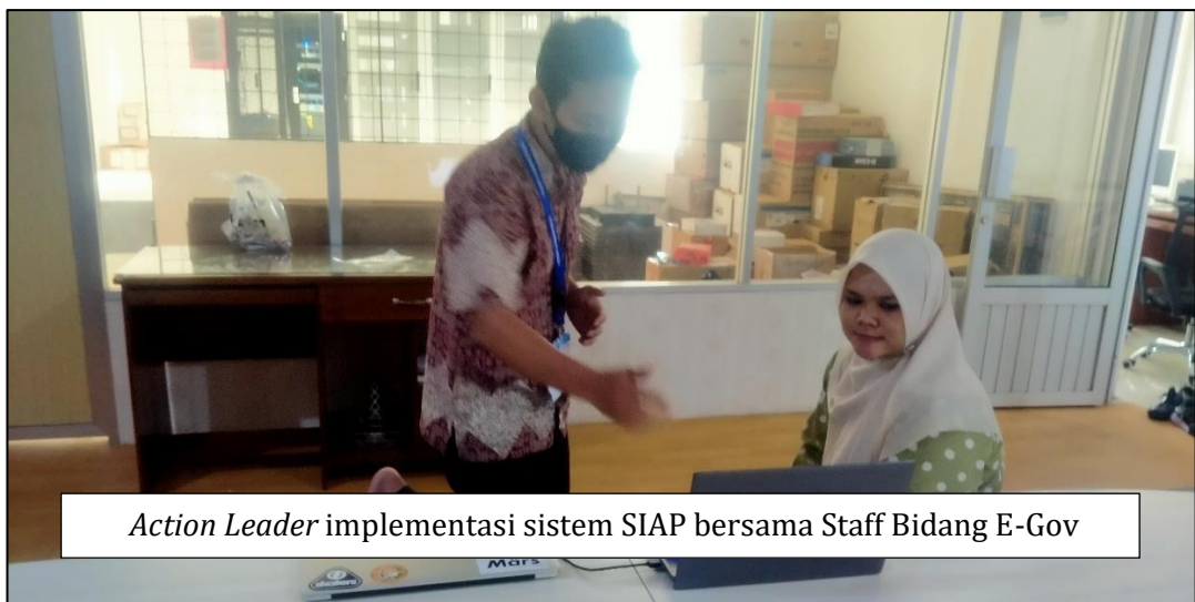
Action Leader implementasi sistem SIAP bersama Staff Bidang E-Gov