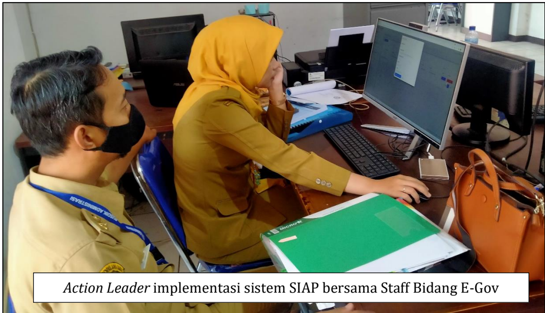
Action Leader implementasi sistem SIAP bersama Staff Bidang E-Gov