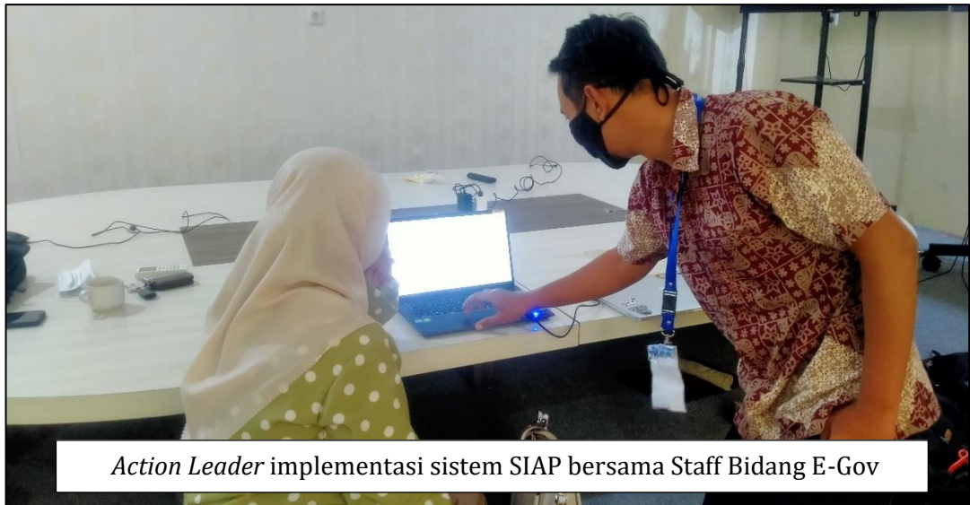
Action Leader implementasi sistem SIAP bersama Staff Bidang E-Gov